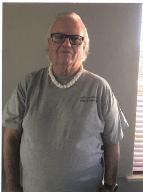
Sin título, por James Bassett

El nombre y el número de teléfono de su CRA o ayudante del CRA es: